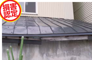
落雪や積雪荷重により屋根が変形・破損。