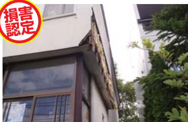
外壁に雪塊が当たった事による破損。