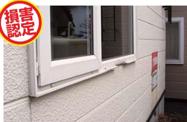
窓・サッシなどへ雪塊が当たり変形・破損。