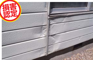
積雪や落雪により、外壁が変形。