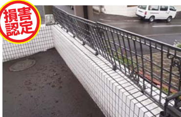
雪や外来物の衝突により、門や塀が変形・破損。