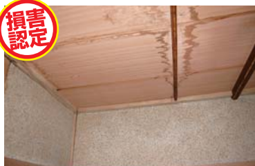
無落雪式屋根（スノーダクト）の排水管が詰まりで室内へ漏水。