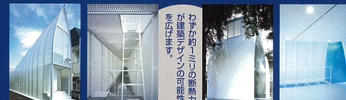
細長い敷地に快適な住環境を実現